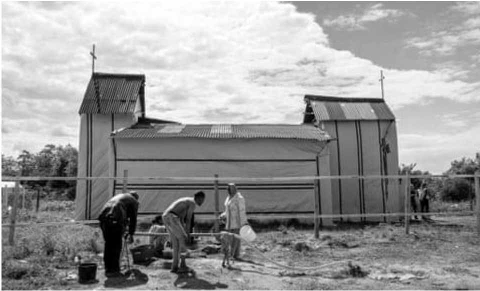
Migrantenkerk in de jungle van Calais