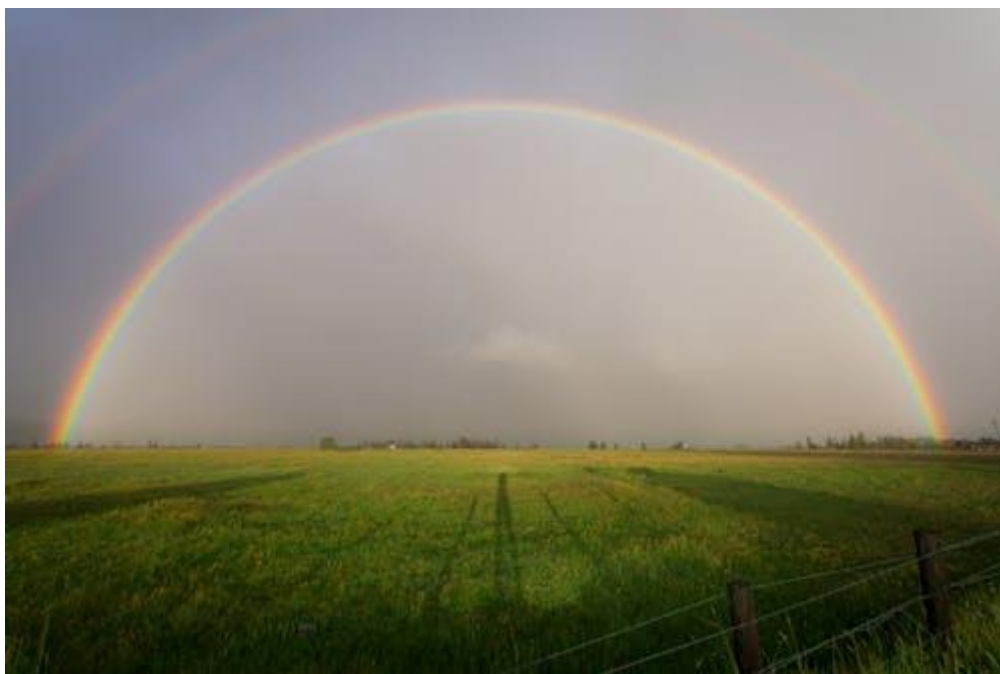
Regenboog, symbool van Gods verbond met Noach en alle levende wezens

Viering van Woord en Gebed 8 september 2024