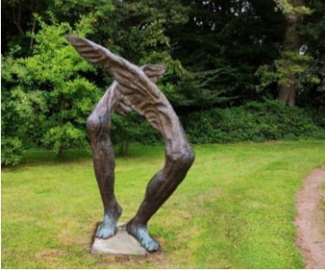
Afbeelding: 'Lichtvoetig' van Helga Kock am Brink 2013

Zalig de voeten van de vreugdebode (vrij naar Jesaja 52,7)