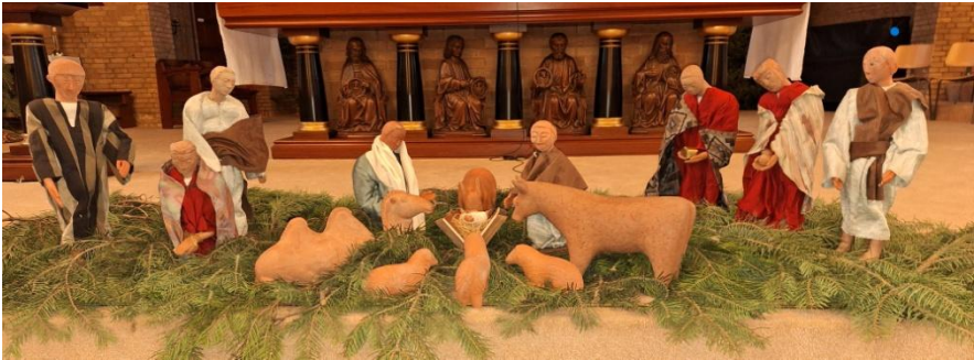
Kerststallententoonstelling 2023 Sint Martinus

nr 26 24 december 2023 tot en met 6 januari 2024