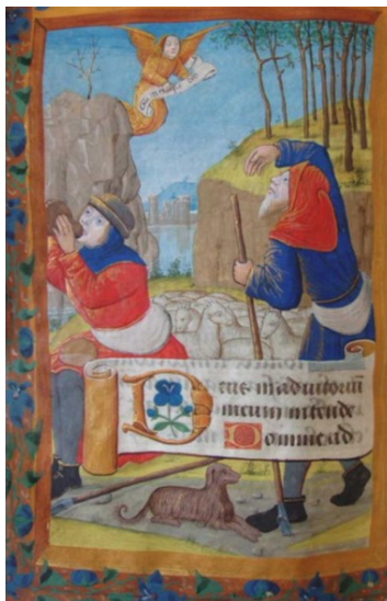
Christus, de gebeurtenissen eromheen en de betekenis

Deze Carol Service is een Nederlandstalige service met Engelse Carols. Er zijn negen Bijbellezingen of verwante verhalen die de reden en belofte van de geboorte van