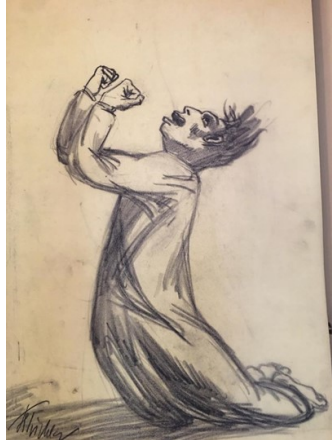
'Job' gezien in de synagoge van Wrocław

Hoe loopt dit af? En wat leert ons het verhaal?