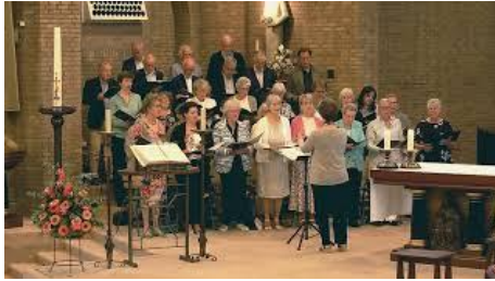
Eucharistieviering 12 juni jl

Op 3 juli a.s. kunt u nog een keer de Rheinberger mis beluisteren, die 12 juni j.l. op de zondag van Het hoogfeest van de Heilige Drie eenheid in de Sint-Martinuskerk is uitgevoerd tijdens de Eucharistieviering. Meer informatie kunt u vinden op de website van Katholiek Amersfoort.