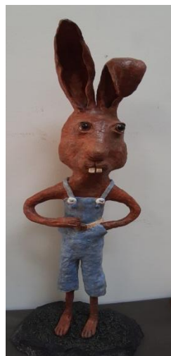
Rietje Eggenkamp- Tolboom